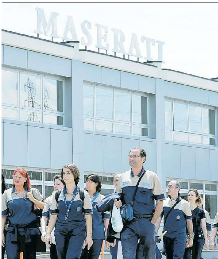
▲ Tute blu Lavoratori alla Maserati di Grugliasco